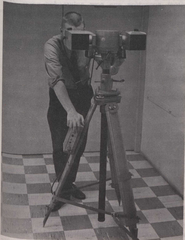
Un opérateur se sert de l'ensemble stéréométrique utilisé dans la nouvelle technique développée à Chalk River pour éviter le séjour prolongé du personnel d'entretien dans les champs de radiation.