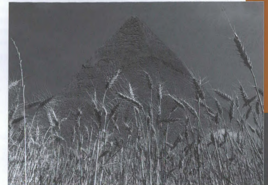
Du blé au pied des pyramides? C'est un mirage, bien sûr... Toutefois, la remarquable progression des ventes de blé canadien en Égypte cette année est bien réelle.

L'ambassade du Canada a joué un rôle important dans cette transaction. Dans le passé, la GASC était réticente à acheter du blé canadien en raison de sa haute teneur en humidité, de sorte que le Canada a été incapable de vendre du blé à l'Égypte depuis trois ans. Au cours de la dernière année, les délégués commerciaux de l'ambassade se sont employés à promouvoir le blé canadien auprès de la GASC.