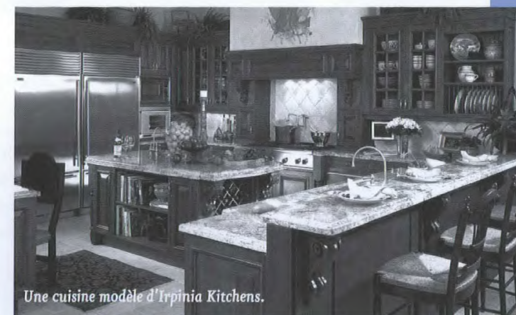
Une cuisine modèle d'Irpinia Kitchens.