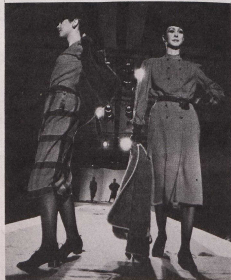
Dos de las modas presentadas en Montreal

Inmediatamente después de los hombros, la atención se concentrará en la cadera, que será realizada con cinturones, fajas an chas así como otros detalles. Luego el