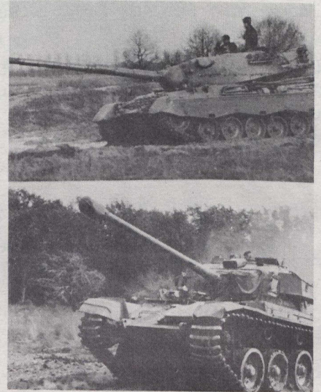
Der erste von 128 neuen Leopard-Kampfpanzern soll im Juli 1978 an die kanadischen Streitkräfte ausgeliefert werden. Die in der Bundesrepublik gebauten Kampfpanzer sollen die 25 Jahre alten Centurion-Panzer ablösen.

Die Leopard-Panzer werden von Krauss-Maffei in München gebaut; ihre Auslieferung dürfte im August 1979 abgeschlossen sein. Für die Zwischenzeit werden 35 Leopardpanzer der Brigade in Deutschland leihweise überlassen. Über 4000 Leopardpanzer sind gegenwärtig in Belgien, Dänemark, der Bundesrepublik Deutschland, den Niederlanden und in Norwegen im Einsatz; auch die australische Armee hat Leopard-Panzer bestellt.