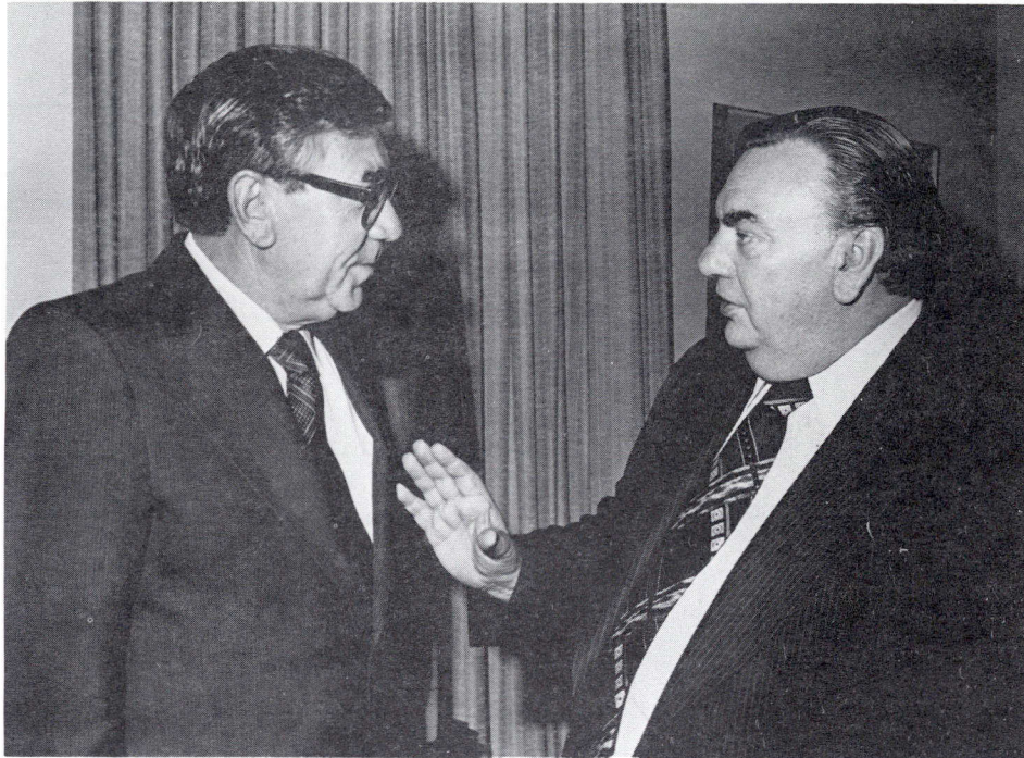
Außenminister Don Jamieson (rechts) im Gespräch mit seinem mexikanischen Kollegen, Lic. Santiago Roel.