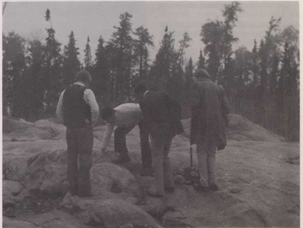
Un groupe de géologues observe des roches plutoniques du bouclier canadien dans une zone de forage située au nord-ouest de l'Ontario.