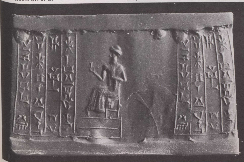
Sceau qui provient de Mésopotamie et date de la fin de la Première époque de Babylone (1711-1684 av. J.-C.).

Québec Hebdo, vol. V, n° 26, 1 er août 1983.