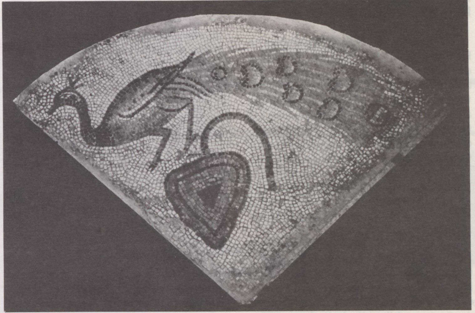
Paon et feuille de vigne sur mosaïque qui vient de la Méditerranée orientale et remonte au VI e siècle ap. J.-C.

Plusieurs des 305 objets, du Moyen-Orient ancien et de la Méditerranée, com-