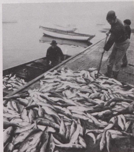
Ce genre de travail manuel sera de plus en plus souvent remplacé par des techniques aquicoles perfectionnées.

été négligé jusqu'ici est l'élevage des animaux aquatiques. C'est avec grand plaisir que nous avons noté que les dirigeants des pays les plus industrialisés envisagent sérieusement de favoriser l'aquiculture qui peut, selon eux, con-