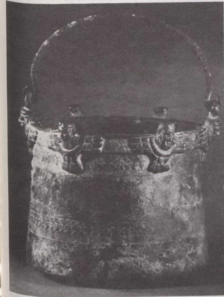
Seau en bronze, orné de protomés, qui est originaire de la Haute Syrie et date du VIII e siècle av. J.-C.