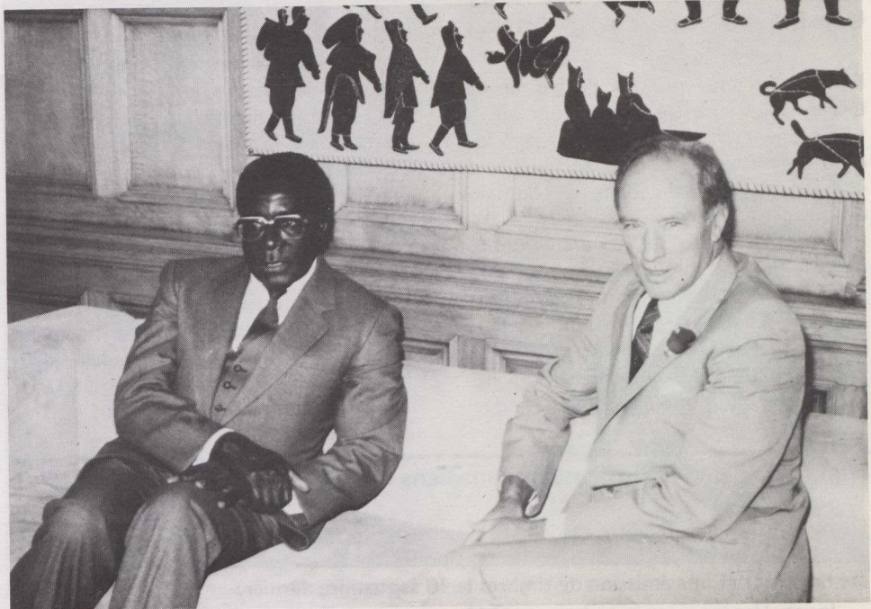
Le premier ministre du Zimbabwe, M. Robert Mugabe (à gauche), a eu, le 16 septembre, une série d'entretiens avec son homologue canadien, M. Pierre Trudeau.

La réalisation des projets futurs s'en trouvera simplifiée puisque les deux