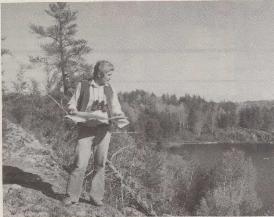
Un chercheur effectue une étude cartographique dans la région d'Atikokan.

1983-1984 comprendront principalement la cartographie et l'étude géologique de la zone entourant le pluton ainsi que certains forages et essais dans les sondages pour déterminer la nappe phréatique et identifier les zones de recharge et décharge possibles avant d'entreprendre des études plus précises.