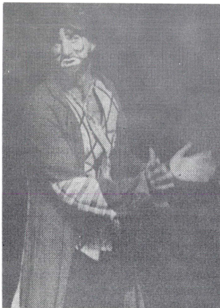
Sol, étonné de son succès.

Les critiques parues dans la presse française ont été très élogieuses; selon certains journalistes: "De tout ce qui est venu du Québec ces dernières années, "Sol" est sans aucun doute le spectacle le plus réussi, le plus original, le plus professionnel et le mieux accueilli. Tous les publics y sont accessibles et c'est un délire incessant pendant 90 minutes. Phénoménal!"