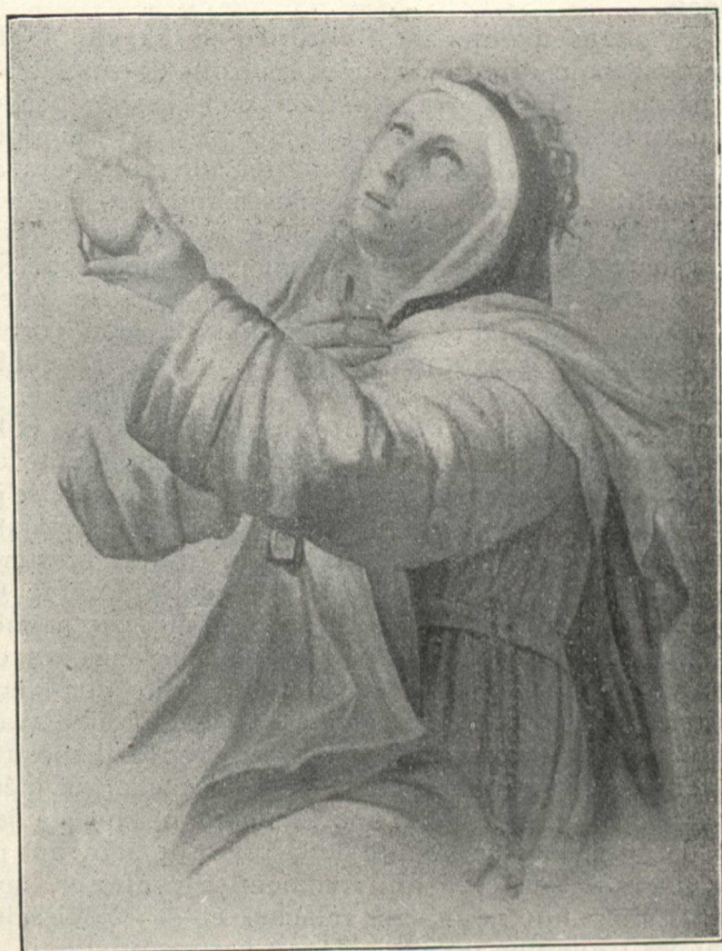
SAINTE CATHERINE DE SIENNE