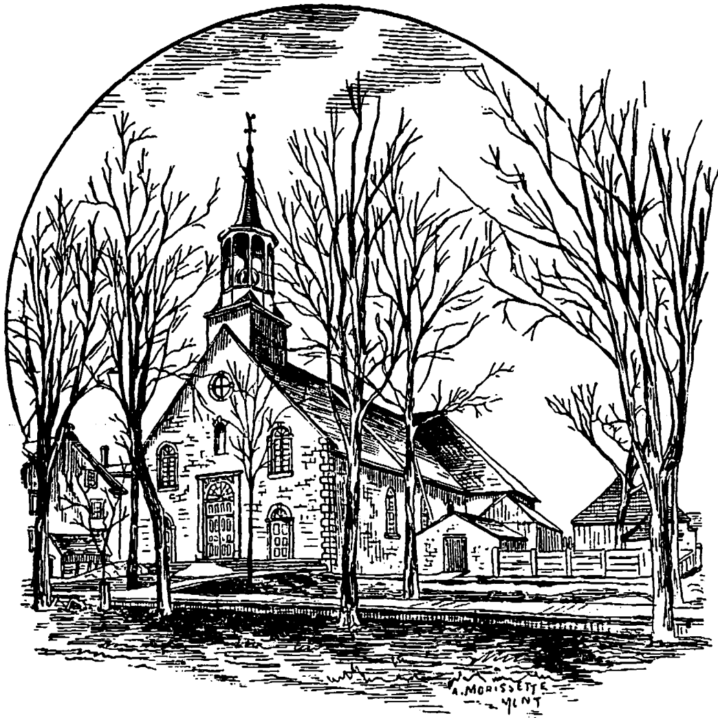
L'église de Saint-Jérôme