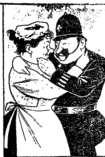
Les baisers à différents âges.