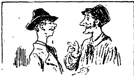
DÉPATIE LE TROU ET BLACK MAINVILLE

Au moment où il s'engageait dans le passage accédant au Petit Nord il vit se détacher dans l'ombre de la silhouette de deux individus à la mine patibulaire.