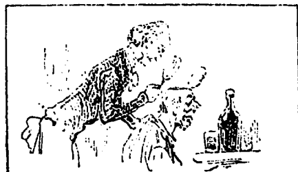
UNE OPÉRATION DÉLICATE

Le chirurgien avait été dérangé dans une opération fort délicate.