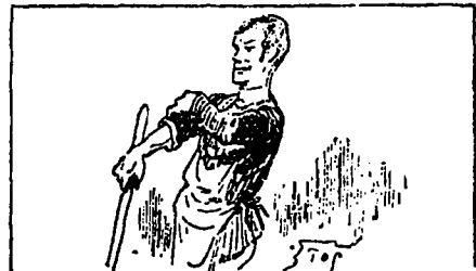
ARMÉ D'UN MANCHE DE HACHE

Les deux personnages mystérieux s'élançèrent sur lui. L'un d'eux armé d'un manche de hache lui asséna sur la tête un coup tellement violent qu'il alla rouler dans le fumier sous la porte cochère.