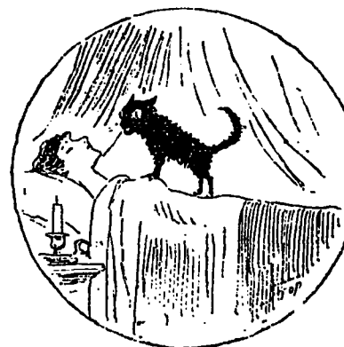
UN NOIR CAUCHEMAR

Lorsqu'il arriva elle devint en proie aux plus noirs cauchemars.