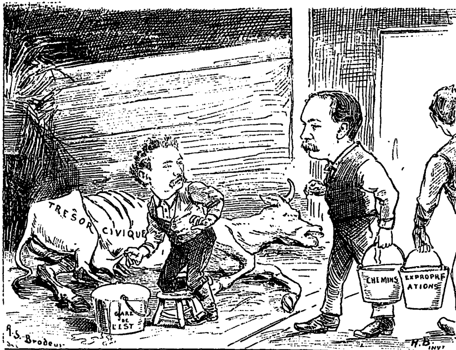
A L'HOTEL DE VILLE

HURTEAU.—Au nom du ciel, arrête tes demandes, mon cher Préfontaine. La vache est rendue à bout. Elle ne peut plus donner une goutte de lait.