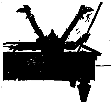
Ne pas trop se pencher.