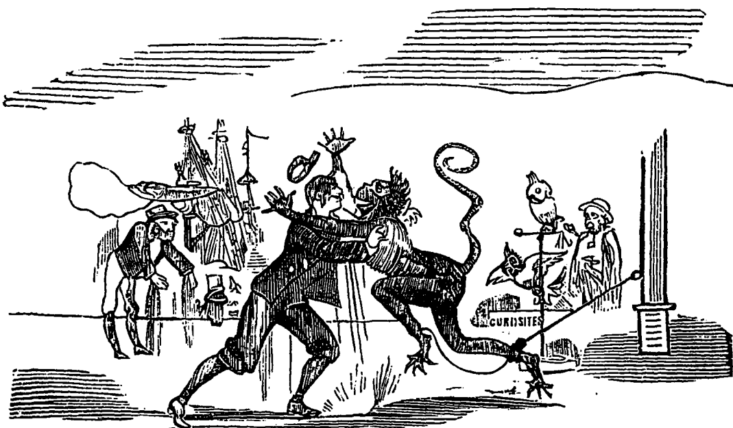
FARANDOUL RETROUVE SON PERE NOURRICIER.

Les prisonniers s'élançèrent d'un bond sur le dos du Nautilus et coururent à l'arrière où les sabords tout grands ouverts les invitaient à entrer;