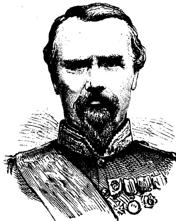
LE GENERAL DE FAILLY.