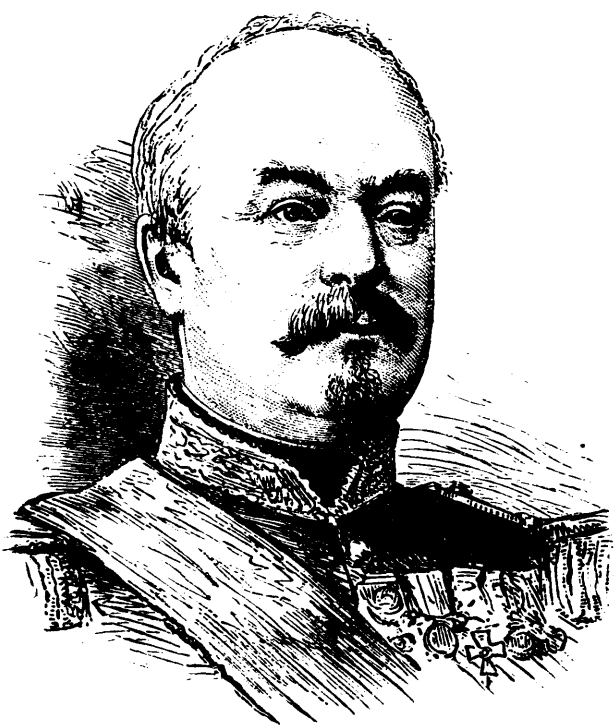
LE MARECHAL BAZAINE.