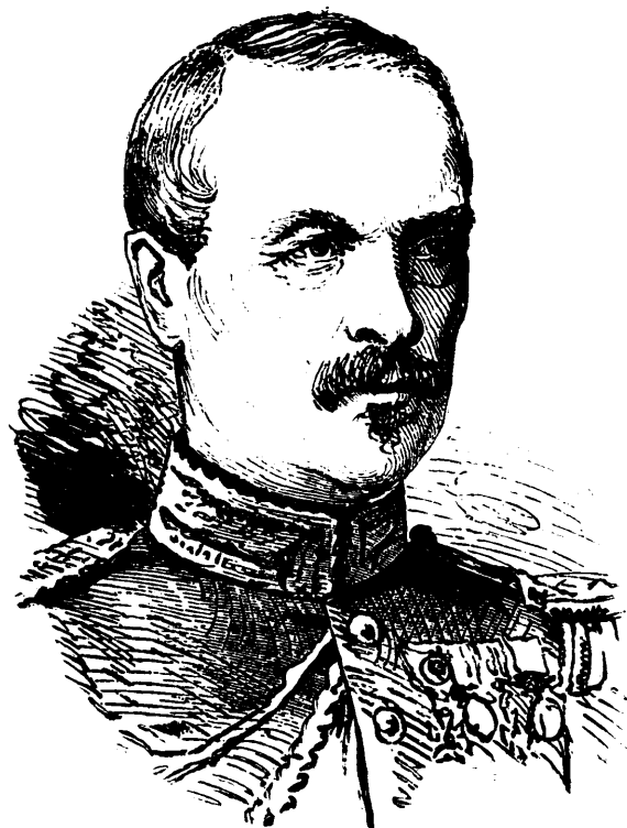
LE GENERAL FROSSARD.

Lors de la guerre d'Orient, Canrobert fait général de division, fut mis à la tête de la 1 re division de l'armée et fit la triste campagne