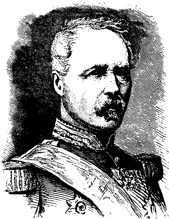
LE MARECHAL McMAHON.