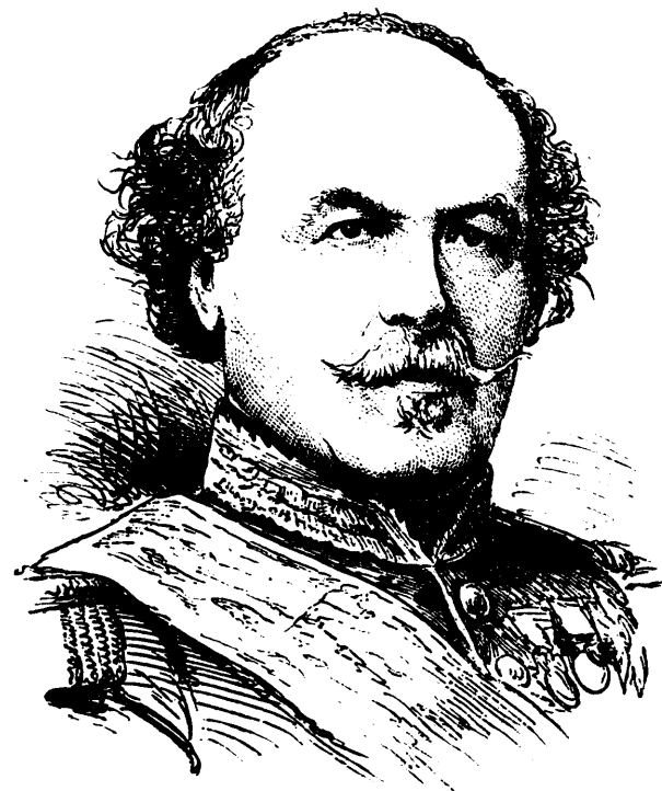
LE MARECHAL CANROBERT.

Une insurrection des tribus algériennes rendit nécessaire son retour en Algérie. Il