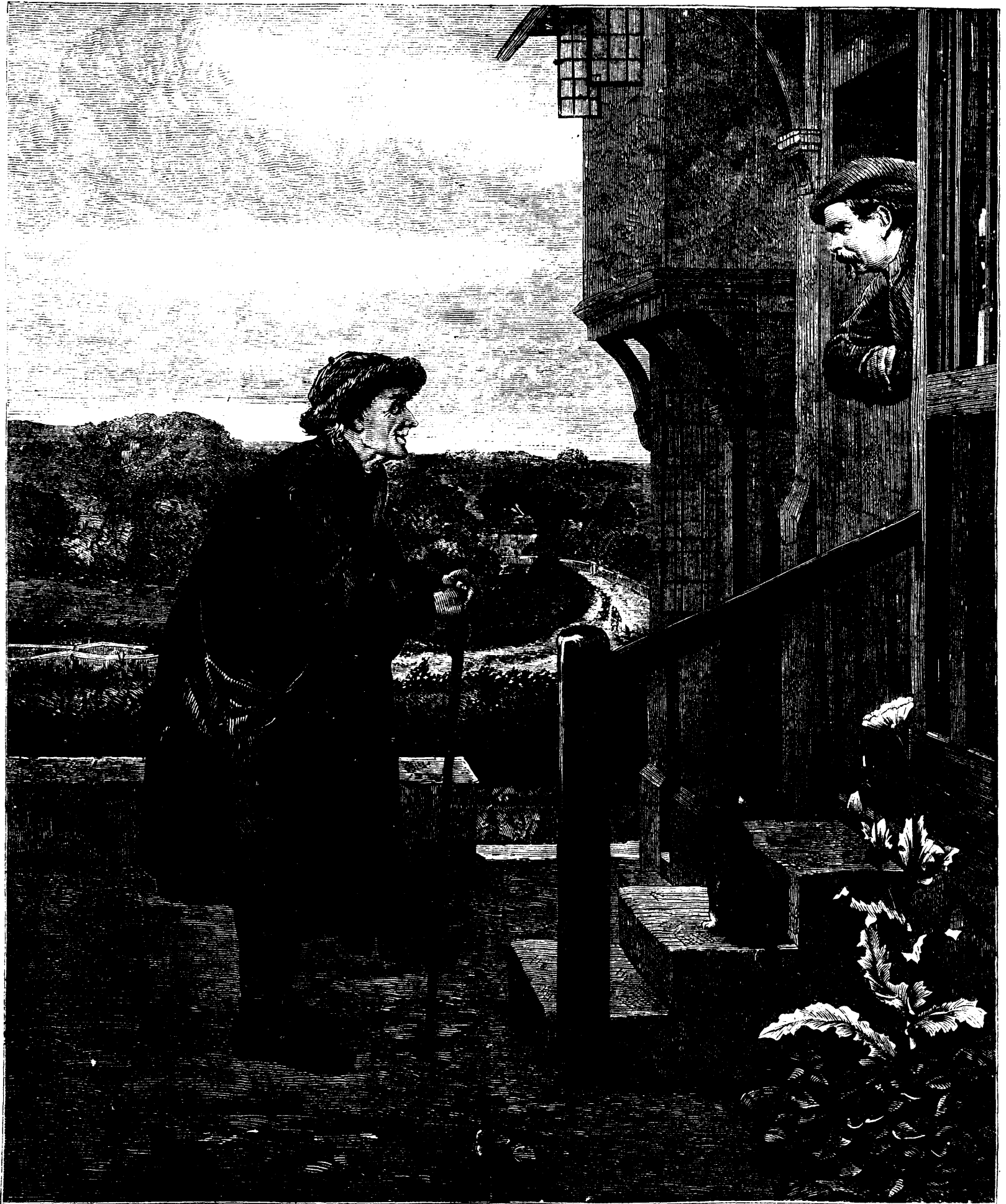
EH BIEN! PÈRE, QUELLES NOUVELLES ?