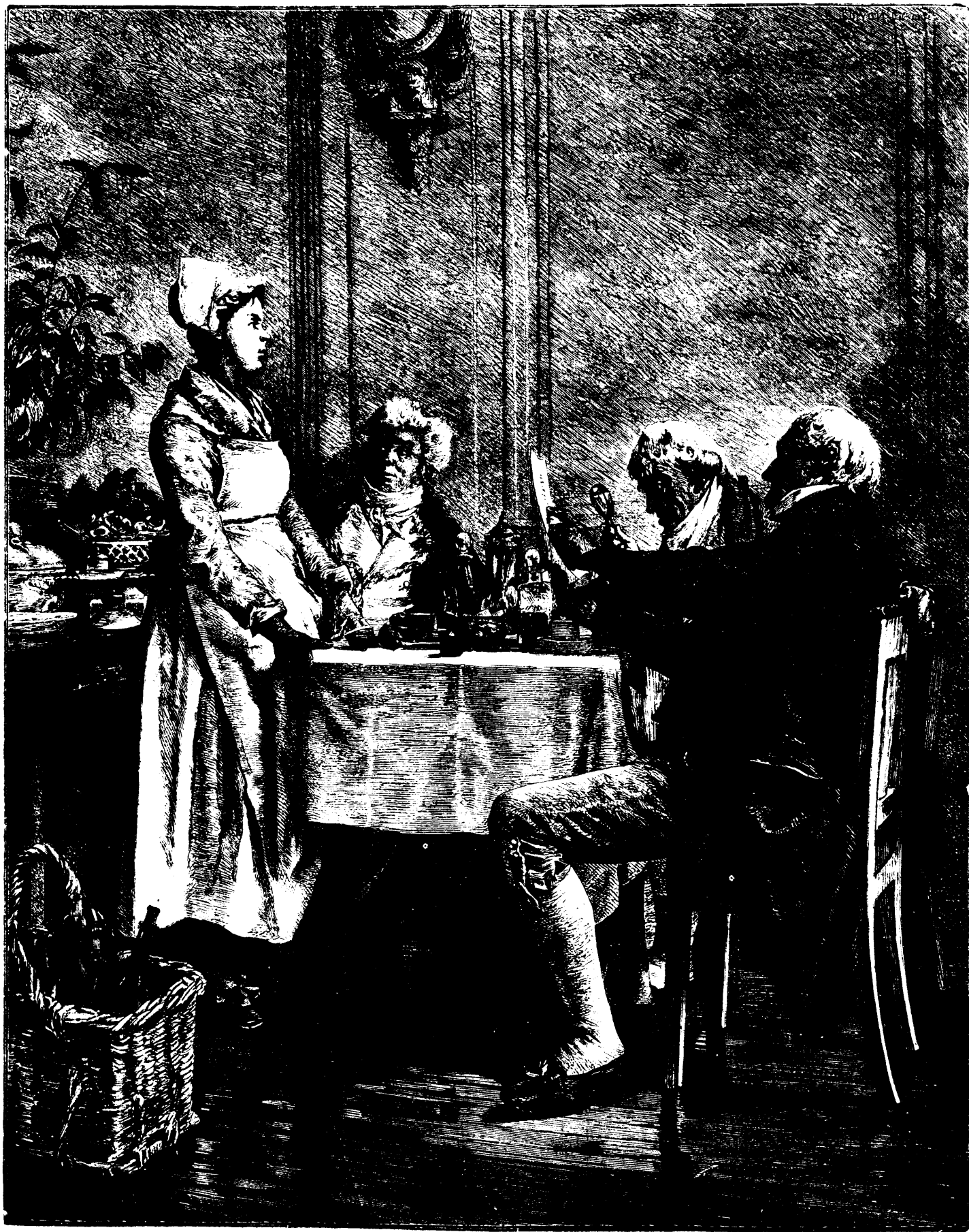
LA CARTE À PAYER.—D'APRÈS LE TABLEAU DE M. LEROUX