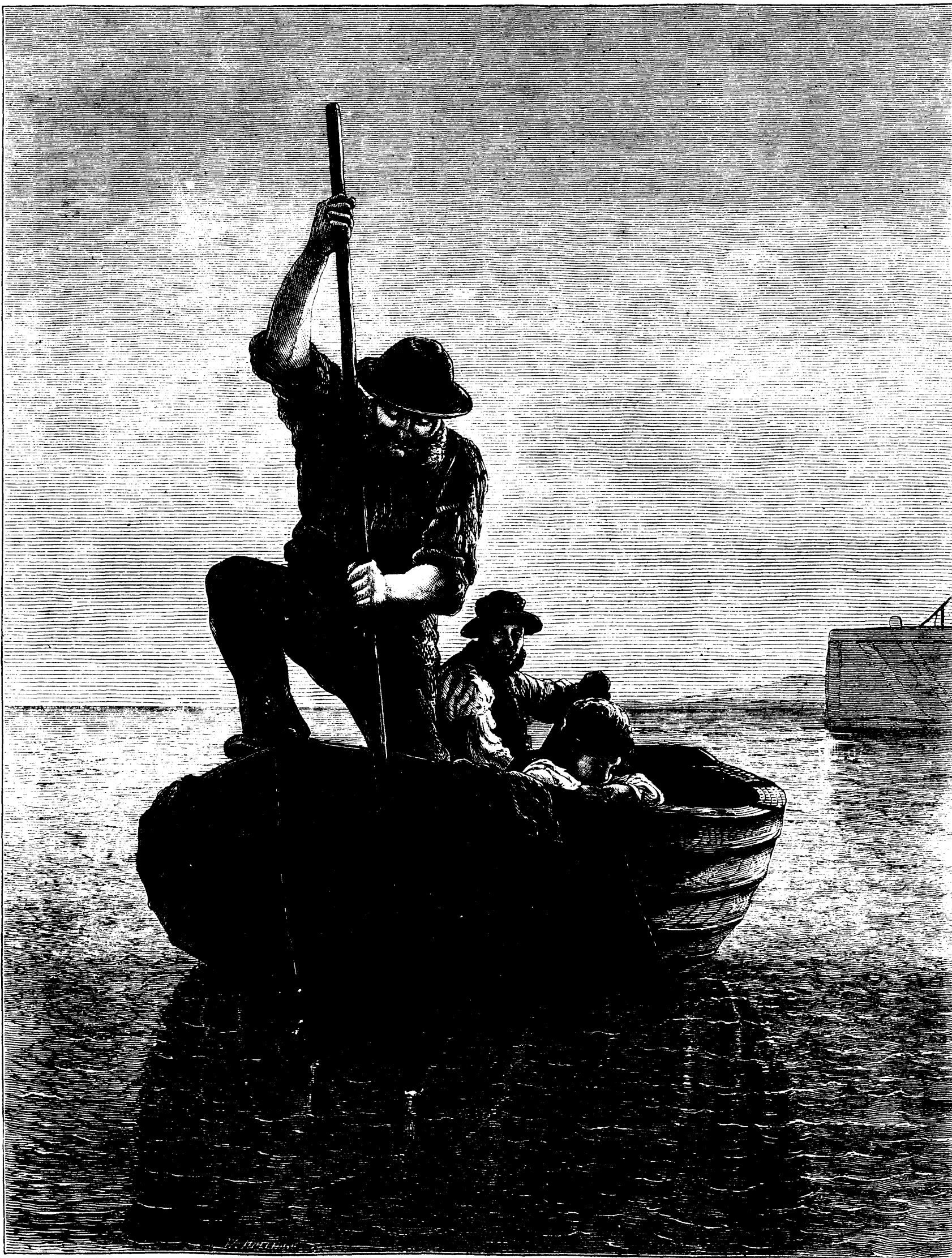
LA PÊCHE AU DARD