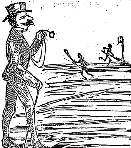
Arthur de Croc enjambe devient amoureux passionné du jeu de crosse. Il se dit : je serai crosseur.