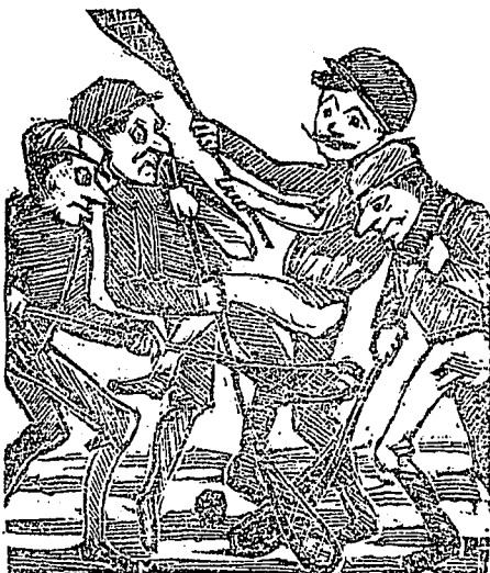
5me. 3me épisode. L'embarras où il se trouve, étant trop près de la balle.