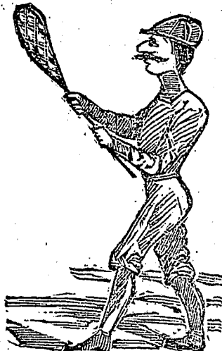
Fraichement costumé il se rend sur le terrain.