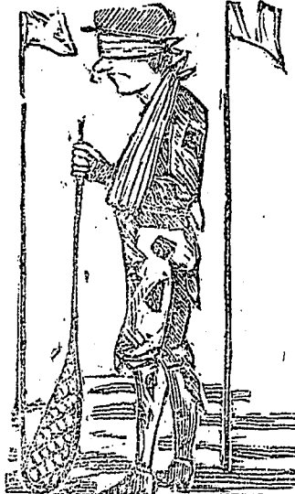
Finalo. Je n'y jouerai plus.