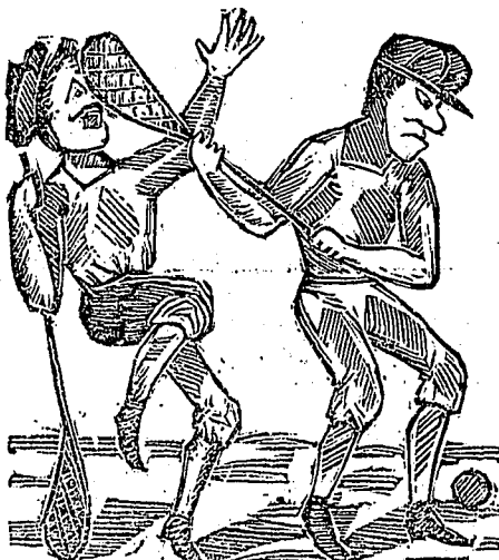
2me épisode. Son nez aquilin devient un nez à la Roxelane.