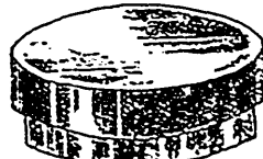
Fig. 7. — Boîte de Petri ou de Rietsch.

formée de deux cristallisoirs de verre très plats et dont l'un sert de couvercle à l'autre. ( A suivre. )