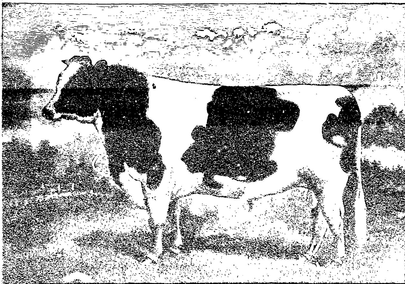
TAUREAU HEREFORD PUR SANG.

Saint-Boniface, Manitoba, 1er Novembre 1890.