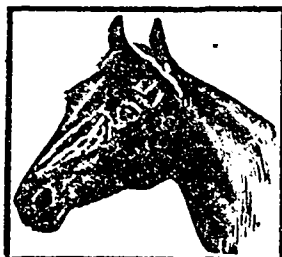
Marque de Fabrique

VOUS L'AUREZ SI VOUS L'EXIGEZ DE VOTRE ÉPICIER