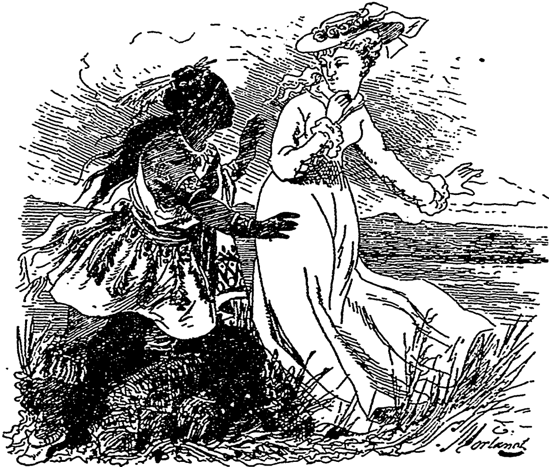
Elle aperçut une femme indienne debout à ses côtés.

— Quoi ! ce sont les Indiens ? demanda le pauvre père tremblant.