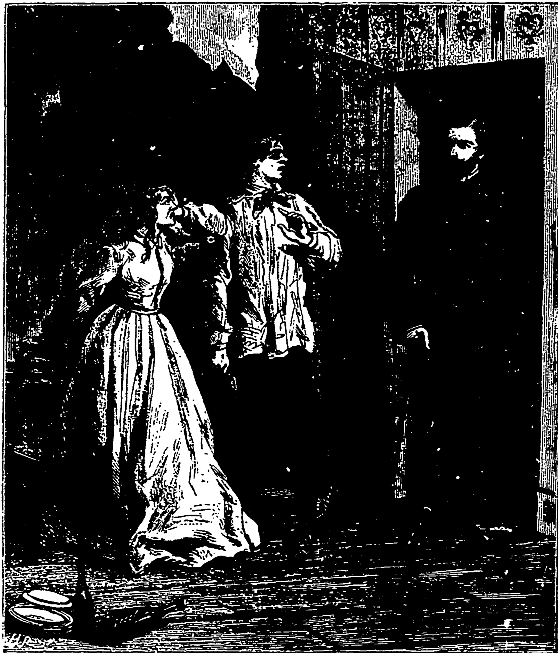
C'est vous qui m'avez fait enfermer ici, demanda-t-elle ? (Page 108)

Le lendemain vers les neuf heures du matin, Robert de Loc-