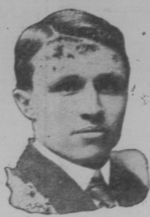
Premier J. G. Gardiner

Premier Gardiner von Saskatchewan nahm in einer großen Versammlung in Regina am 21. Mai an der Feier der 100. Jahrestagung der Provinzialparlamentarier teil. Er sprach über die Bedeutung der Konföderation für die Zukunft Canadas.