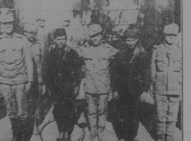
Soldaten der N. H. R. Armer, die nach ihrem Gießen auf Schmutzsteinlager in Ruffids Rollen auf die Treppe...