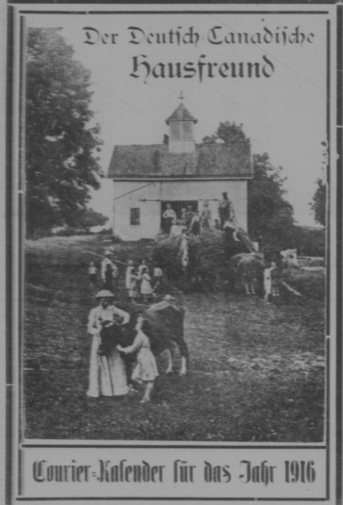
Der 1916 Kalender enthält einen reichhaltigen Lesestoff, der im Buchhandel etwa drei bis vier Dollars bezahlen müßten