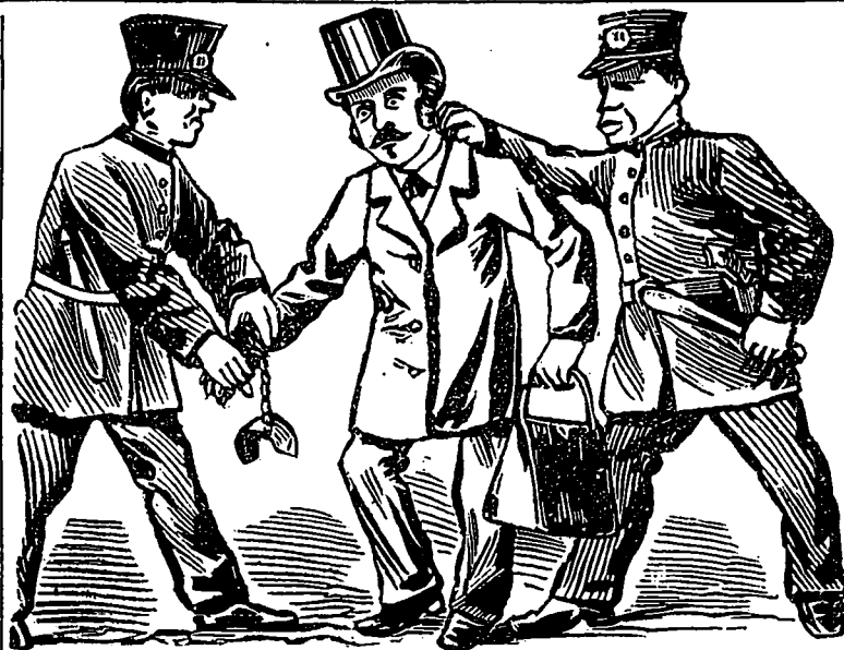
LE COMMIS VOYAGEUR A QUEBEC.

Pour nous ici, dans ce district, nous ne serions pas fâchés de voir introduire dans le Code Canadien, l'art. 132 du Code Prussien, ou quelque chose d'analogue qui rendrait un juge responsable de ses mauvais jugements.