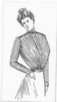
VIGNETTE No 5

Blouse entièrement composée de plissés verticaux. Manches ajustées.