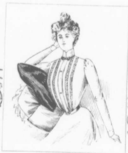
VIGNETTE No 3

Blouse dont le devant est formé de 3, 5, 7, ou 9 rangées d'insertions assez fortes. La blouse en question est un des derniers modèles provenant de New York.