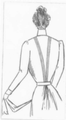
VIGNETTE No 2

La blouse de couleur blanche sera la grande mode cet été. Elle semble avoir détrôné celles de couleur. Notons ce-