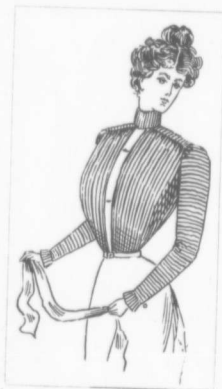
VIGNETTE No 4

Nous reproduisons quelques modèles de blouses. Les vignettes sont inédites et faites d'après les derniers modèles, créations de MM.