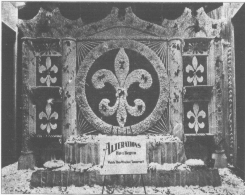
Planche No 13. — Fonds de Vitrine "Fleurs de Lys."

Avec un peu de goût et de talent d'adaptation, on peut former une variété infinie de fonds artistiques.