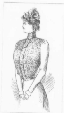
VIGNETTE No 1

Blouse avec devant en dentelle point Suisse avec collet "Stock Collar" de même que le devant de la blouse. ... Cette blouse est faite avec manches ajustées. Les poignets sont dans la forme "Bell Cuff."