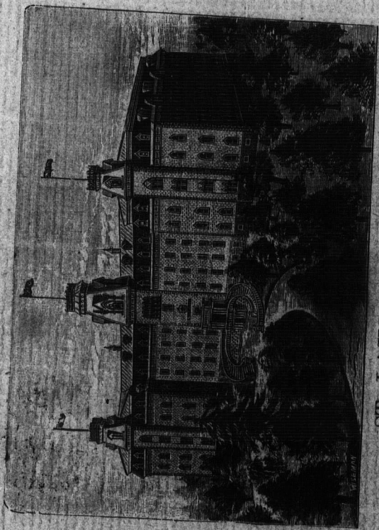
ST. LAURENT COLLEGE.