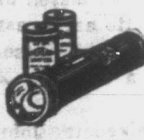
ÖT teljes sorozat kártyáért