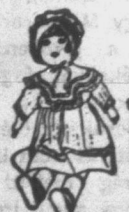
NYOLC teljes sorozat kártyáért