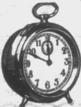
ÖT teljes sorozat kártyáért