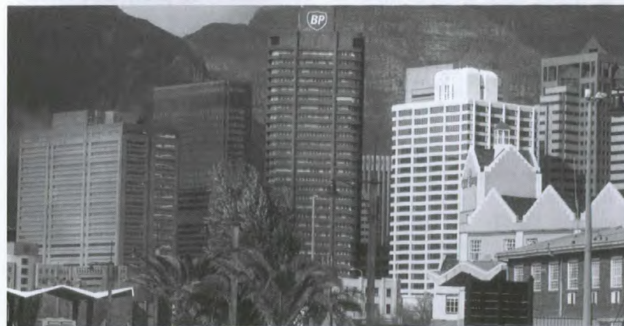
Le franchisage en Afrique : Cape Town en Afrique du Sud est un bon point de départ.

(Pour obtenir la version intégrale de cet article, consultez www.dfait-maeci.gc.ca/canadexport sous « Institutions financières internationales ») 🇨🇦