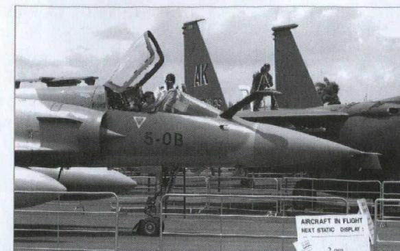
Aire d'observation des aéronefs à Asian Aerospace 2004

En marge du salon, les délégués commerciaux de six pays de l'Asie du Sud-Est se sont rencontrés pour former une équipe régionale de l'aérospatiale