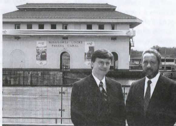
Le ministre d'État (Marchés nouveaux et émergents) Gar Knutson, et l'administrateur adjoint du canal de Panama, Ricaurte Vasquez, au cours d'une visite aux écluses Miraflores. Le projet d'expansion de plusieurs milliards de dollars du canal de Panama devrait offrir des débouchés aux entreprises canadiennes.