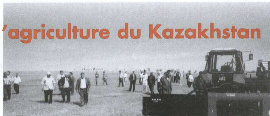
Présentation d'une moissonneuse-andaineuse : DonMar un fabricant de machinerie agricole expose ses produits dans une steppe près de Lisakovsk au Kazakhstan central.

Le Kazakhstan est le sixième producteur de blé au monde. Depuis l'effondrement de l'Union soviétique il y a plus de 10 ans,