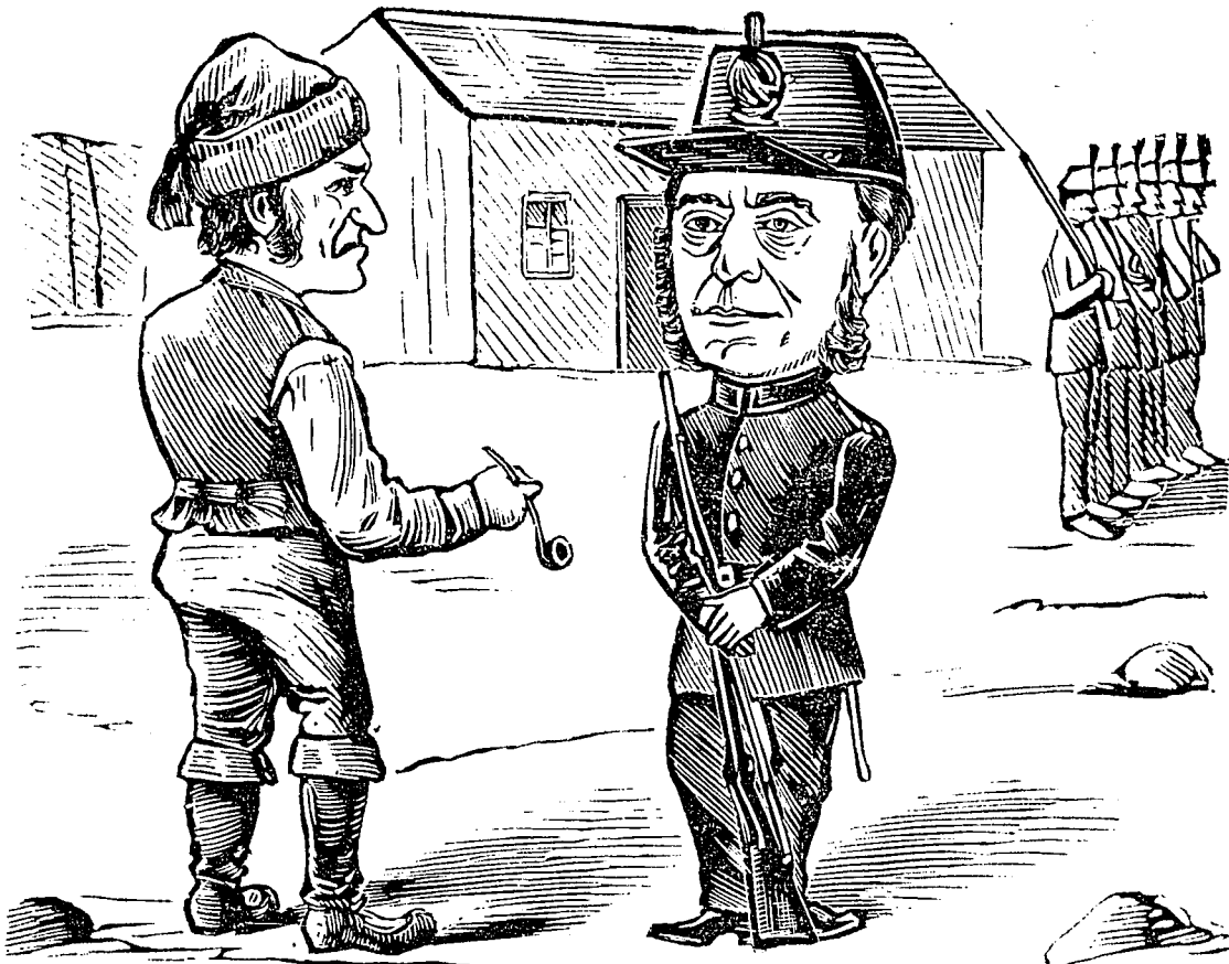
LADÉBAUCHE.—Un habit rouge parmi les habits bleus. Il est toujours au Stare et Ease . On va te driller, mon vieux, Right about face, break off!

Une jambe de bois, peut-être? Écoutez, on en fait aujourd'hui qui sont merveilleusement arti-