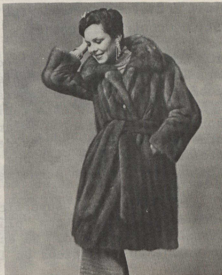
Abrigo de Samink Real Natural diseñado por I. Wasserman Incorporated para la Furmillion Corporation de Manitoba.

En 1965, Raymond Couture advirtió la existencia de un animal totalmente distinto de los otros visones de St. Pierre Fur Bearers Limited, de Carman, Manitoba. Este visón tenía una piel dos o tres veces más espesa que la de los mejores visones, con toda la apariencia de la cebellina, la "reina" de las pieles.