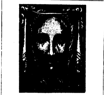
VRAIE IMAGE DE LA

Sainte Face de N. S. Jésus-Christ qui est conservée et vénérée très religieusement à Rome en la Basilique de Saint-Pierre au Vatican.