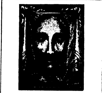
THE TRUE IMAGE OF THE

Holy Face of Our Lord Jesus-Christ which is preserved and venerated very religiously at Rome in the Basilica of St. Peter.