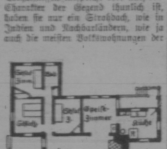
Bungalow - Plan.

herstellen lassen. Auch die einfachsten derselben sind modern, ja die elegantesten am meisten. Natürlich kommen sie im Winter bauen läßt.