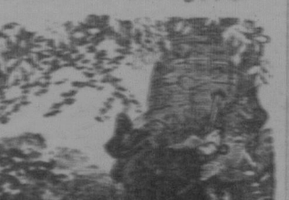
Ein moderner Kriegergeschicht.