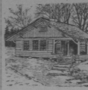
Bungalow aus Holz mit Baumstamm-Verkleidung.