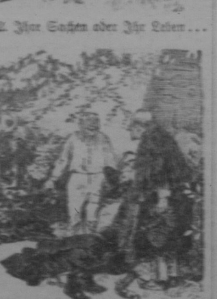
2. Hier stehen aber die Leuten...