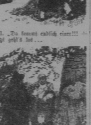
1. Da kommt endlich einer!!!