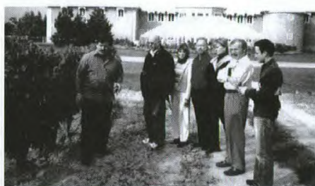
La délégation mexicaine s'initie aux vins de glace à la vinerie du Château des Charmes dans la région de Niagara

Une délégation d'importants acheteurs de vins et de journalistes mexicains est récemment retournée au Mexique avec le sentiment d'avoir découvert une toute nouvelle région vinicole : le Canada.