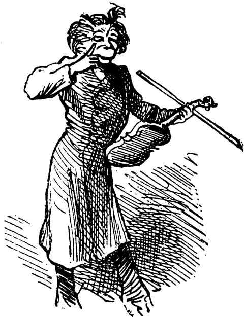
LE CLUB DES MENTEURS