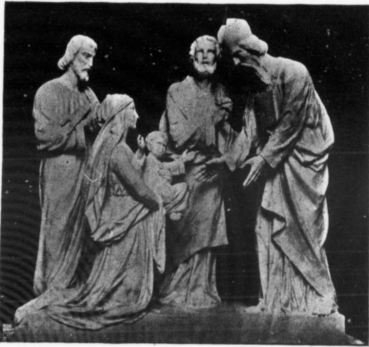
4ème MYSTÈRE JOYEUX. La Présentation.