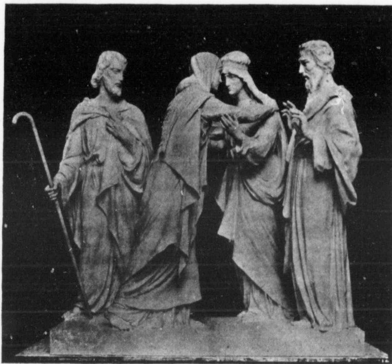
2ème MYSTÈRE JOYEUX. La Visitation.