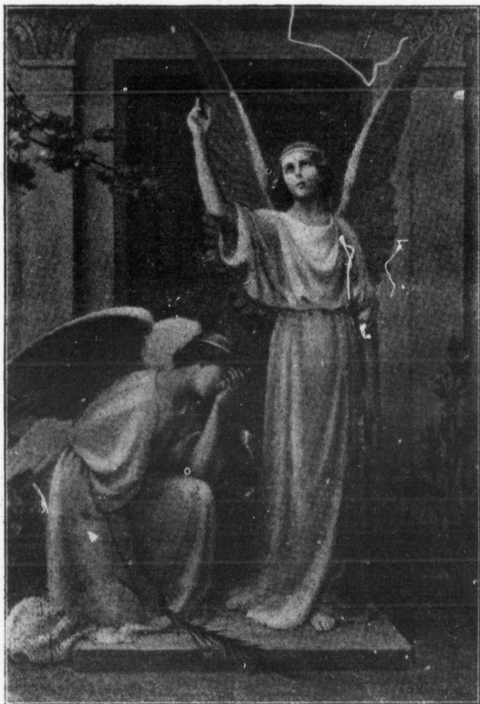
LA RÉSIGNATION ET L'ESPÉRANCE