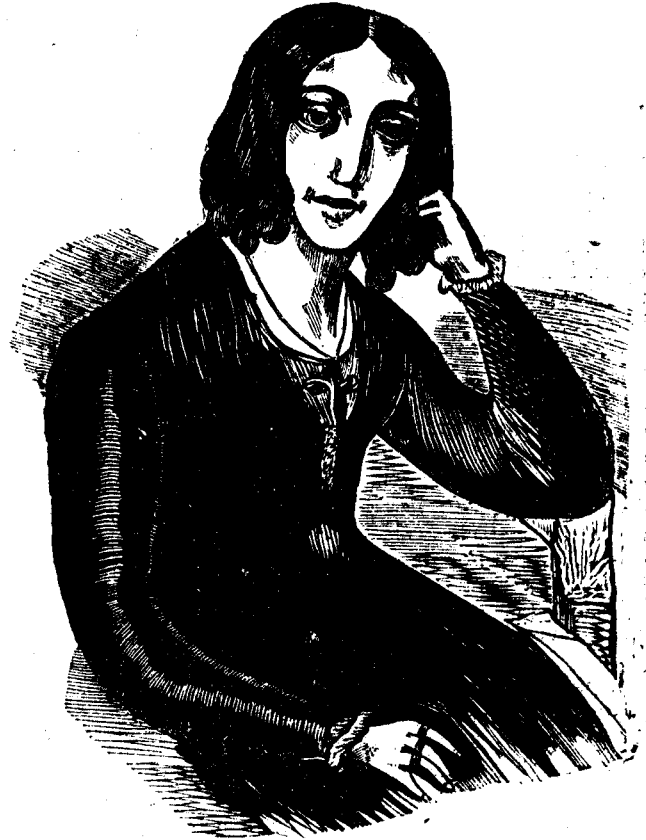
(PORTRAIT DE GEORGE SAND.)

— Au reste, ajouta-t-il, mes nièces sont restées unies par une invincible tendresse. Le presbytère n'a rien perdu de sa propreté, ni le jardin de son éclat. Arpalice est plus fraîche que jamais, comme vous voyez; on chante toujours, on rit toujours comme devant; on lit toujours l'Imitation ; on prie avec ferveur, et Dieu bénit les cœurs simples. Si une personne chez nous est plus sereine et plus contente de son sort que les autres, c'est certainement Arpalice.