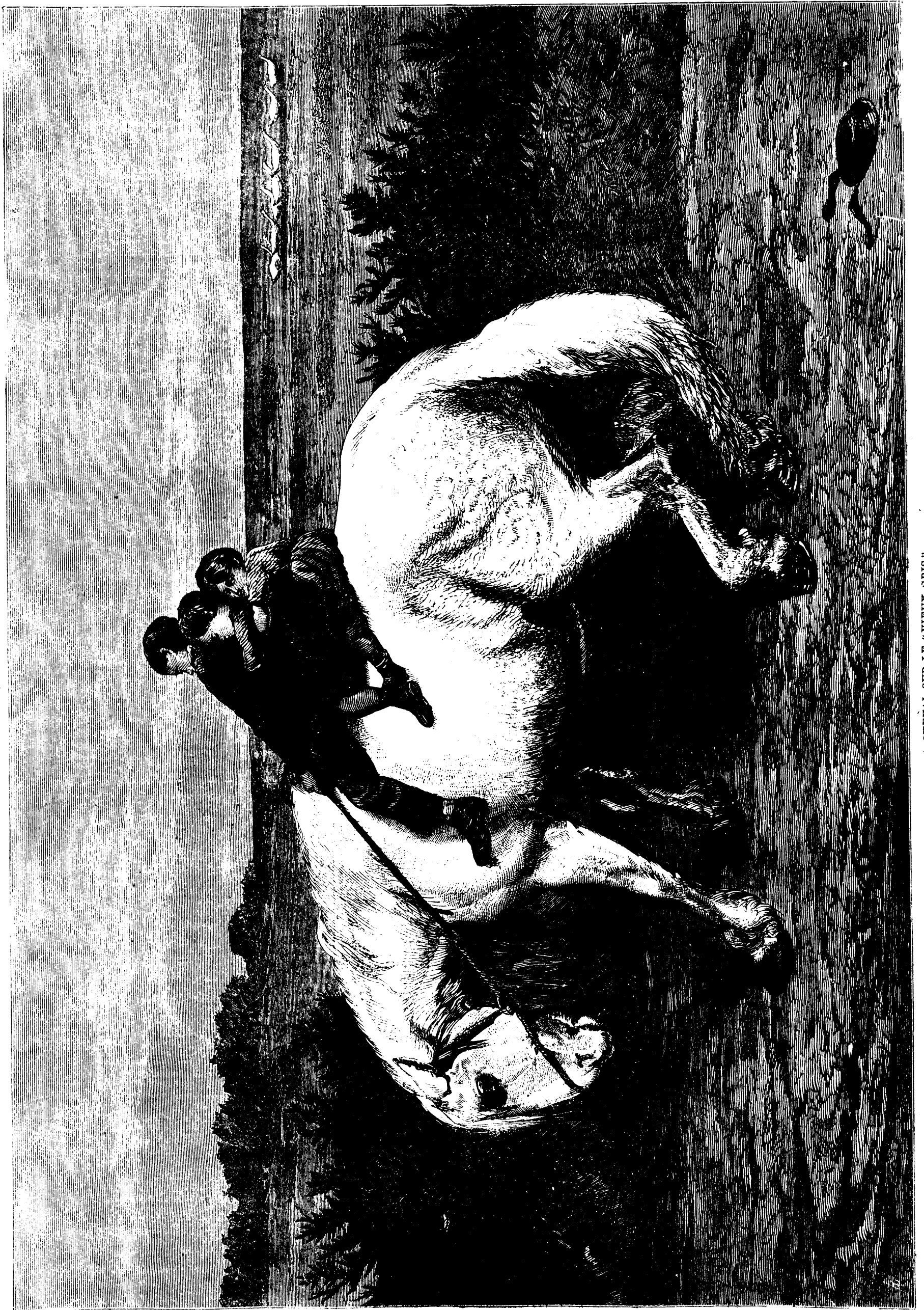
A CHEVAL SUR LE "VIEUX GRIS"