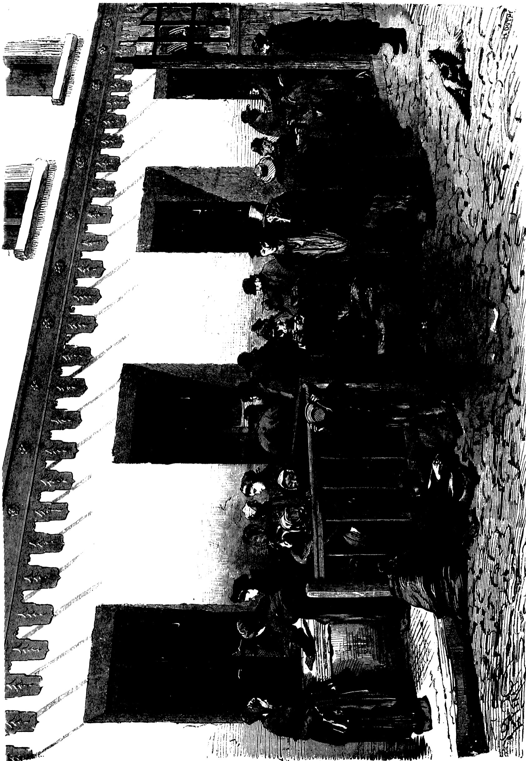
LES FOURNEAUX ÉCONOMIQUES À PARIS.—DISTRIBUTION DE VIVRES