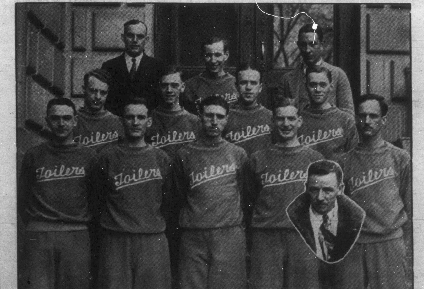
Fenti képkünkön láthatók a winniepei Y. M. C. A. kötelékébe tartozó Toiler basketbally csapat tagjai, akik a pozdorjává zuzott repülőgép utasai voltak. Közülük kettő meghalt, a többiek súlyosan megsebesültek.

EGY 22-es kaliberű flóbert okozta halálát egy Alonsa manitóbai farmernek. A Mounted Police-ok eddig még nem tudták megállapítani, hogy gyilkosság vagy öngyilkosság történt-e. A gyilkos golyó a farmer homlokán furódott be.