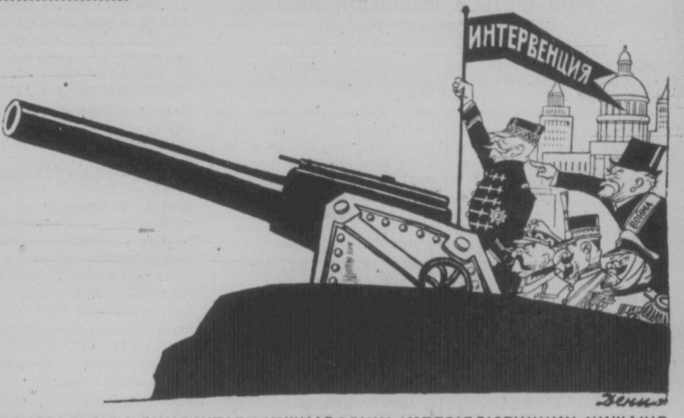
ГЕНЕРАЛЬСЬКА ЛІНІЯ ШТАБУ МІЖНАРОДНИХ ІМПЕРІАЛІСТИЧНИХ ХИЖАКІВ.

Виконання плану в галузі колективізації дасть абсолютну перевагу соціалістичних елементів над осібною галузю в селі, закріпить злуку робітничої класи з трудящими масами селянства й завершить будову фундаменту соціалістичної економіки СРСР. Це буде подія всесвітньо-історичного значіння".