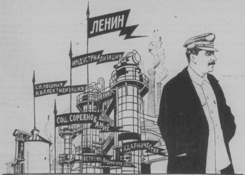
ГЕНЕРАЛЬНА ЛІНІЯ ЦК ЛЕНІНСЬКОЇ ВСЕСОЮЗНОЇ КОМУНІСТИЧНОЇ ПАРТІЇ.

КАПІТАЛІЗМ Є В ПЕРІОДІ ЗАГНИВАННЯ Й НЕМИНУЧОЇ ЗАГИБЕЛІ