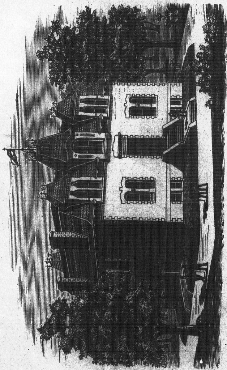
BATISSE DE L'ECOLE DE MEDECINE ET DE CHIRURGIE. VIS-A-VIS L'HOTEL-DIEU, MONTREAL.