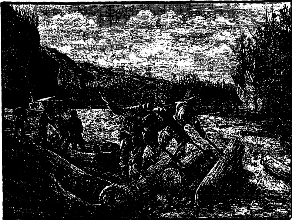
LA DESCENTE DU BOIS VERS LE MOULIN A SCIE.

un bon nombre abusait de cette abondance, ne pensant qu'à manger, à boire et à s'amuser : ils croyaient que ça durerait toujours et n'avaient pas l'air à s'occuper d'autre chose. J'ai connu des habitants qui achetaient une tonne de rhum et un baril de vin pour leur provision de l'année : la carafe et les verres avec les croixignoles étaient toujours sur la table, tout le monde était invité, on ne pouvait pas entrer dans une maison sans prendre un coup . On avait même fait un refrain, que le maître de la maison chantait dès que ses visiteurs faisaient mine de partir :