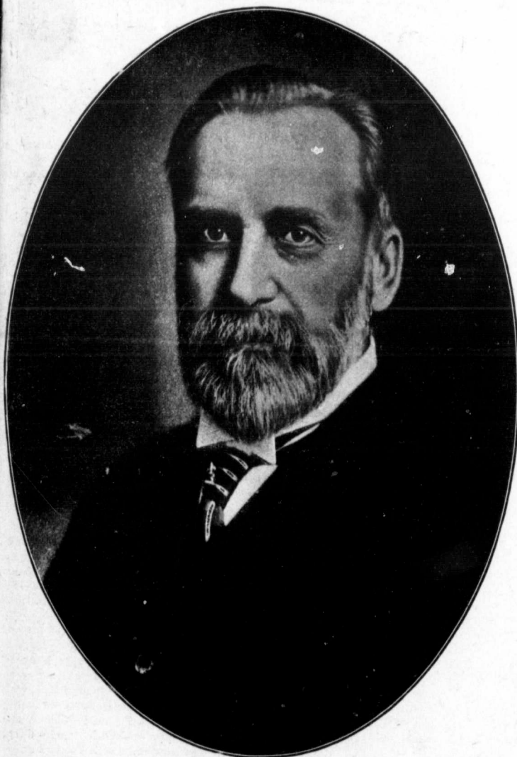
L'HONORABLE HORMISDAS LAPORTE