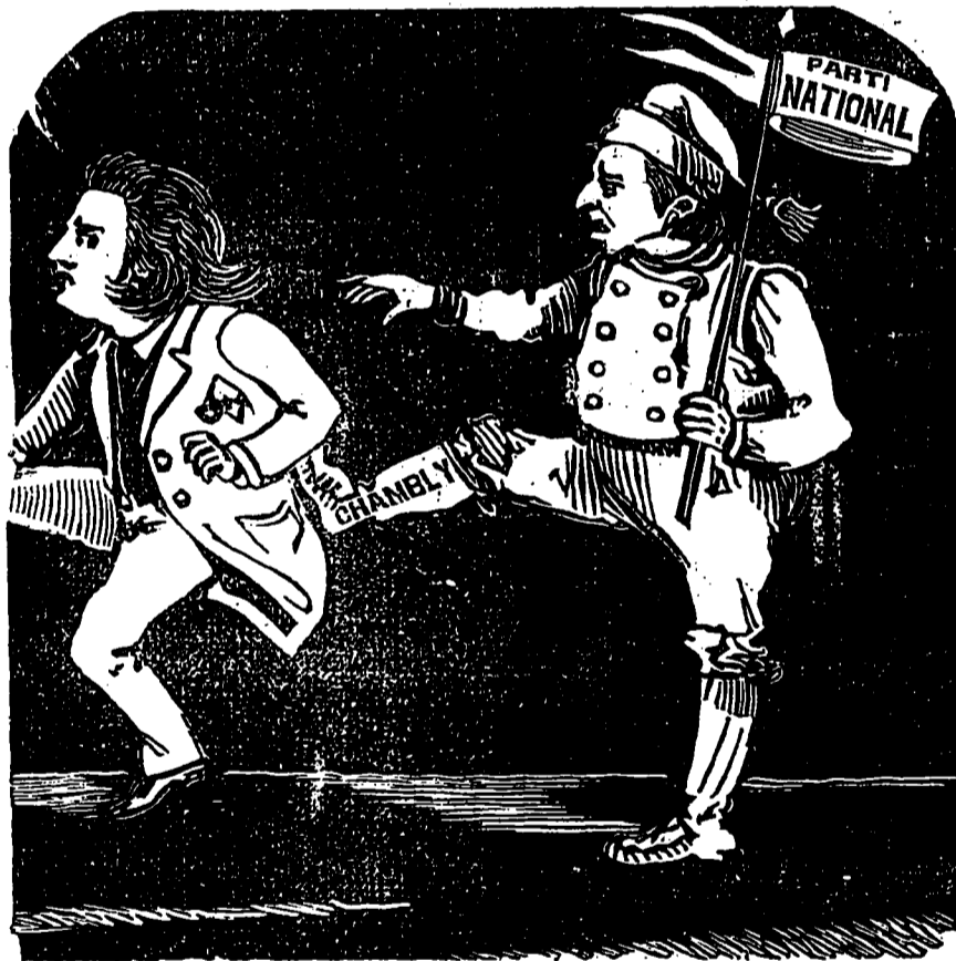
UN FAMEUX COUP DE PIED !