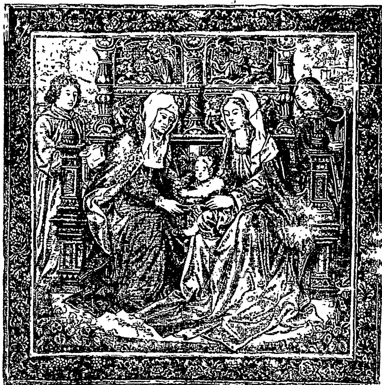
SAINTE ANNE et la SAINTE VIERGE