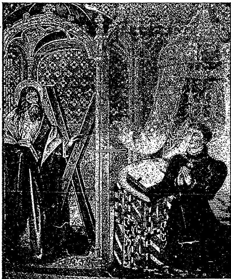
SAINT ANDRÉ APOTRE