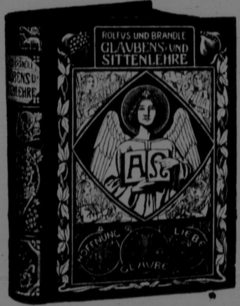
Einband zu Rolfus, Glaubens- u. Sittenlehre