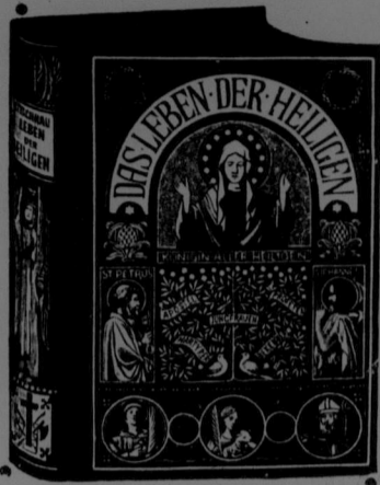
Otto Bittmann, Leben d. Heiligen.