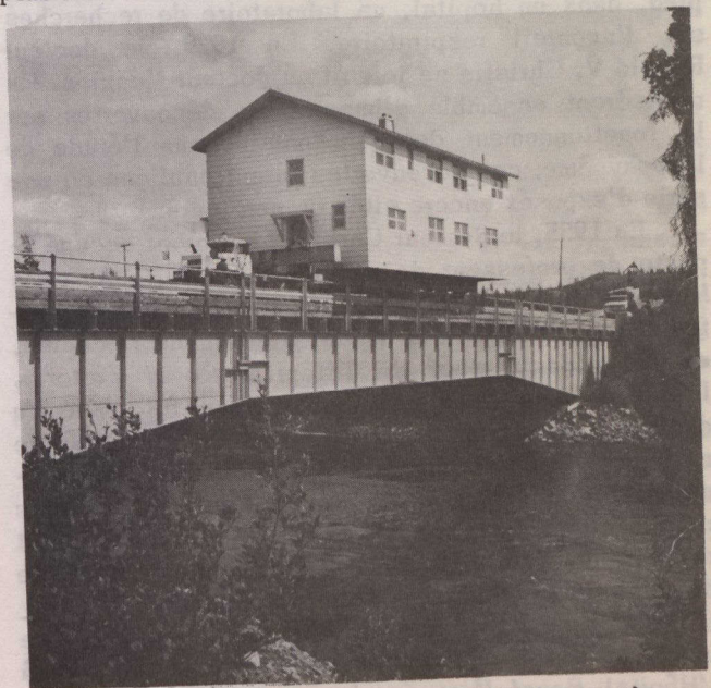
Photo prise au cours du déménagement de la première des sept maisons de Twin Falls, qui doivent être transportées à Churchill Falls (Terre-Neuve).

M. Dufort porte un intérêt tout particulier à ce déménagement: Il a travaillé à la construction de plusieurs des maisons de Twin Falls, en 1962. "Il