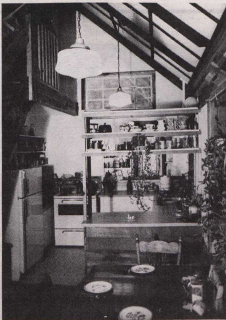
Blick auf die EBküche mit den geöffneten Luftklappen der Trombéwand. Die Solarkollektoren befinden sich oberhalb der Decke.

Die Energieeinsparung beginnt mit dem Fundament aus imprägniertem Holz, das einen isolierten kriechhohen Raum umgibt, der als Warmluftspeicher dient. Das Fundament aus imprägniertem Holz wurde gewählt, weil es einmal eine haltbare Wand hergibt, die leicht isoliert und abgedichtet werden kann; zum anderen finden unerfahrene Bauleute die Möglichkeit, an einer kleinen Fläche die hölzerne Innenwandkonstruktion zu erlernen, bevor sie an die Hauptwände des Hauses herangehen.