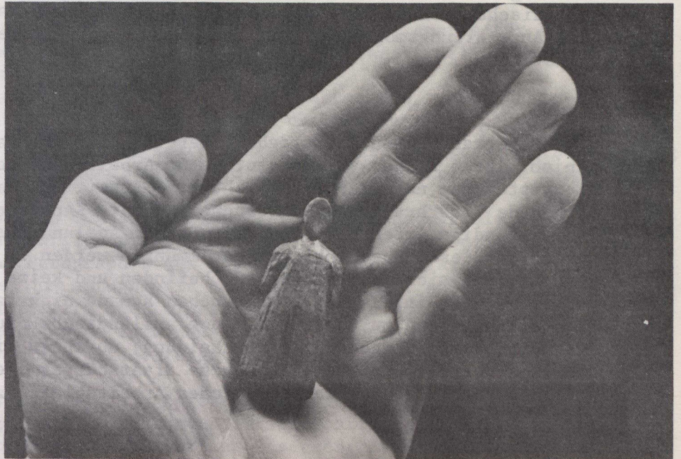
Diese Schnitzerei aus feingemasertem Holz - wahrscheinlich Fichtenholz - ist gerade etwas mehr als 5 cm lang. Sie wurde kürzlich an einer alten Eskimowohnstätte auf einer Halbinsel der Hudsonstraße südöstlich von Lake Harbour (Baffinland) entdeckt und führt die Archäologen zu der Annahme, daß die Europäer tiefer als bisher angenommen in die kanadische Arktis eingedrungen sind.

Im Einzelnen zeigt die Wikingerfigur sehr feine, wahrscheinlich mit einem Quarzkristall eingeritzte Linien, bestehend aus einer Passe zwischen den Schultern und über der Brust des Gewandes, zwei Säumen oder Ziernähten, die vertikal von der Passe bis hinunter zu einem Schlitz laufen, der in Hüfthöhe anfängt. Ebensolche Nähte umrahmen den Schlitz von