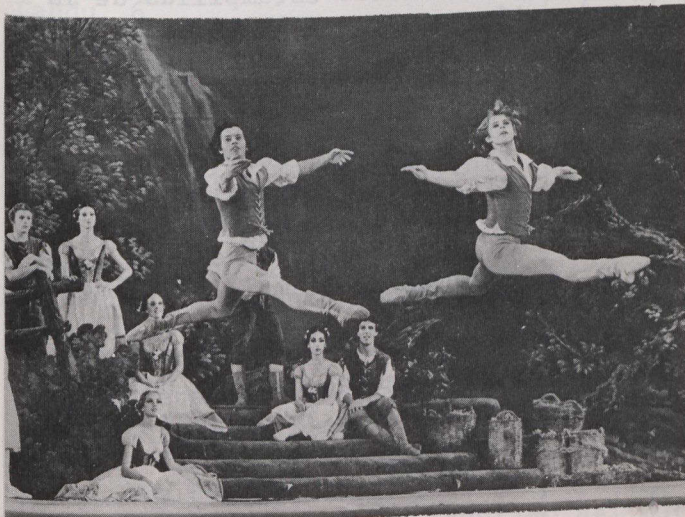
Giselle , por el Ballet Nacional de Canadá.

El Centro mezcla el contenido de sus programas, incluyendo artistas canadienses, atracciones internacionales y producciones "internas" para descubrir talentos. La temporada 1973-74 mantuvo este equilibrio con resultados económicos satisfactorios.