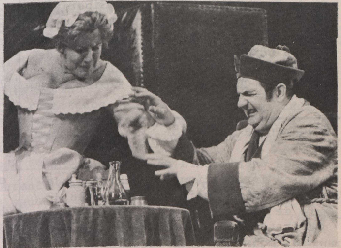
El Enfermo Imaginario , por la Comedia Francesa.