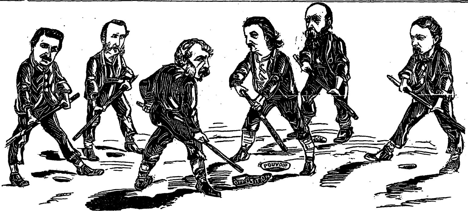
LES BLEUS ET LES ROUGES JOUANT "A LA TRUIE"